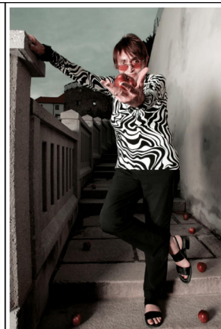
VĚRA CHYTILOVÁ - scenáristka a režisérka fotografie ze série PROMĚNY / METAMORPHOSIS / FESTIVAL NAD ŘEKOU PÍSEK 2009