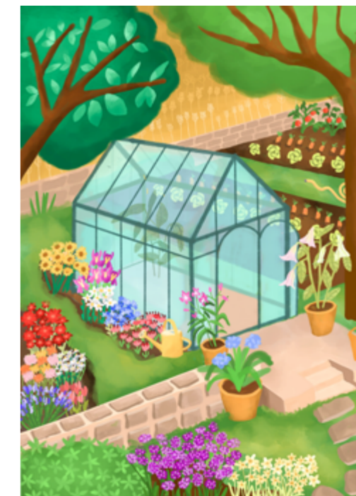
Vozičkárka Petra Veselá našla v malování terapii i zálibu

potřetí, bývá představena různorodá tvorba od malby, fotografie, keramiky, sochy až po šperky. Vystavující se i tento ročník rozhodli některá svá díla věnovat do aukce na dobročinné účely. Výtěžek z prodeje vybraných uměleckých děl bude věnován přímo Centru Paraple, o.p.s., které pomáhá lidem po náhle vzniklém poškození míchy. Své klienty podporuje v jejich seberealizaci krátce po úrazu i v průběhu dalšího života.