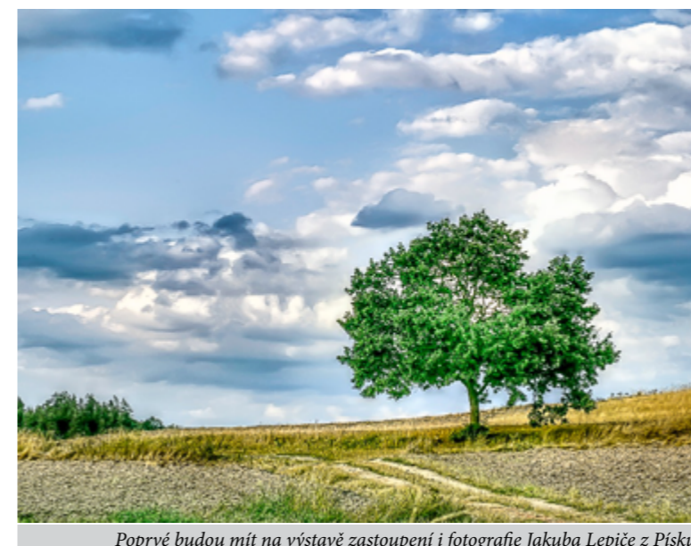
Poprvé budou mít na výstavě zastoupení i fotografie Jakuba Lepiče z Písku