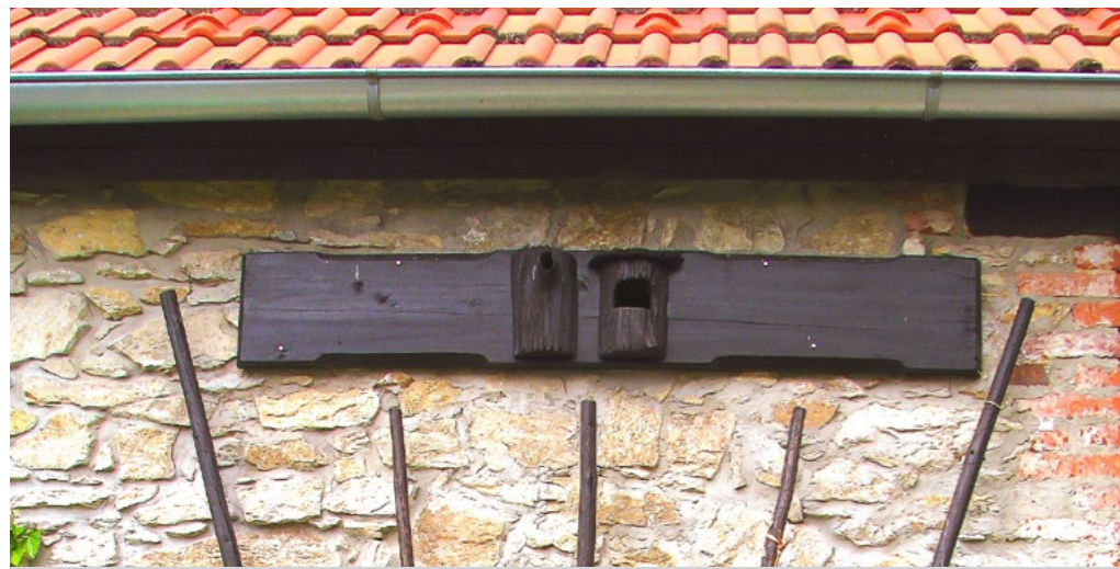
Dvě budky využívající dutiny pro chov holubů. Vlevo pro vrabce, vpravo pro rehy. K. Pecl

U mého bratrance na Moravě si pár vlaštovek