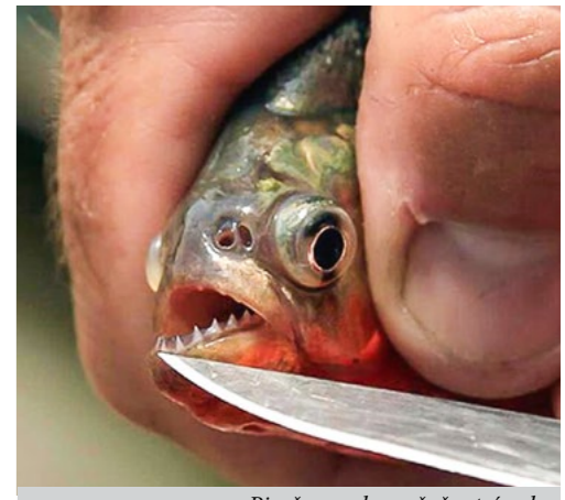
Pirana – nebezpečné ostré zuby

Překvapivé bylo, že všechny snahy o ulovení byly marné. Dalším překvapením bylo, že žádný kajman na Aleše nezaútočil. Když už pomalu nebylo po čem sáhnout, rozhodl se Aleš, že zkusí další tůň poblíž finky. I tam se situace opakovala. Vidina prohry a ztráty prestiže Aleše donutila