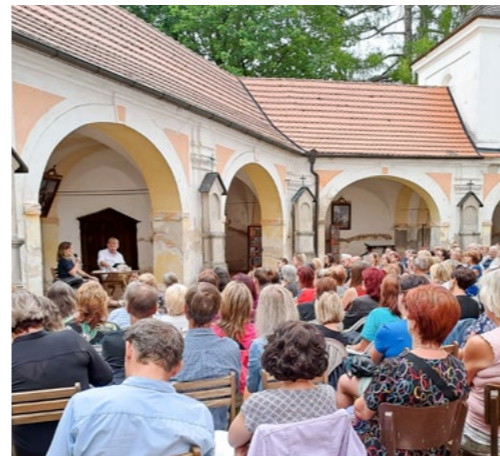
Na setkání s královnou české detektivky dorazila bezmála stovka jejích fanoušků.

Knižky jsem začala psát při novinářině, ale bylo