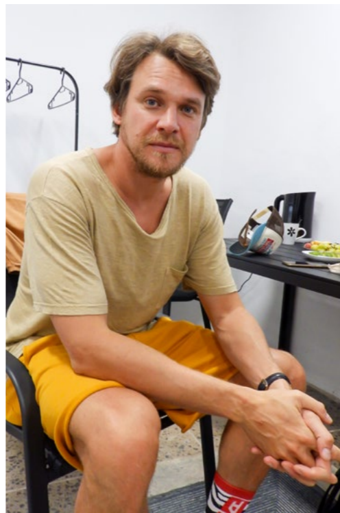
Herec a zpěvák Vojtěch Dyk před koncertem v Písku