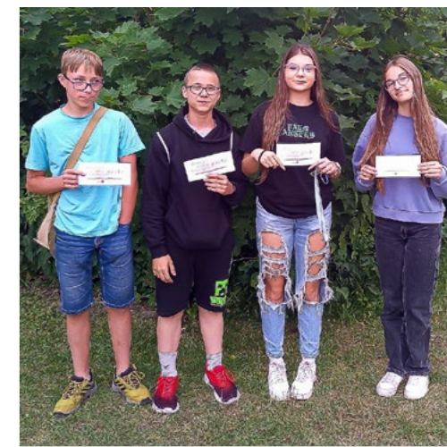
Oceněná redakce časopisu Šobrožáček