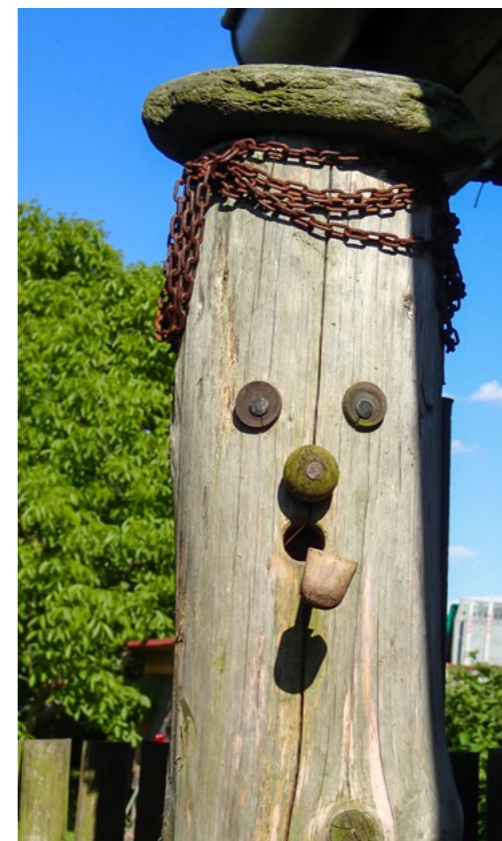
Umělecké ztvárnění budky v dutině kmene. K. Pecl

Další typ pomoci zvířatům je zaměřen už na konkrétní skupiny zvířat nebo jednotlivé druhy . V těchto případech už může často pomoci každý, kdo má rád přírodu a její obyvatele. Škála praktické pomoci je široká. Hmyzu pomůže, když budeme mít na zahradě bohatý sortiment kvetoucích rostlin a trávu nebudeme sekat na typ „golfové hřiště“. Pomůže i instalace hmyzích domečků a čmelínů. Tím podpoříme nejen hmyz, ale i ptáky. A nejde jen o ptáky hmyzožravé, jako jsou například sýkory, ale i zrnožraví ptáci loví v době hnízdění hmyz, aby jim nakrmili svá mláďata. „Masitá“ potrava urychluje růst ptáčat a tím se zvětšuje šance na jejich vyvedení bez ztrát. Ptáččí hnízdo s mláďaty je totiž místem nebezpečným.