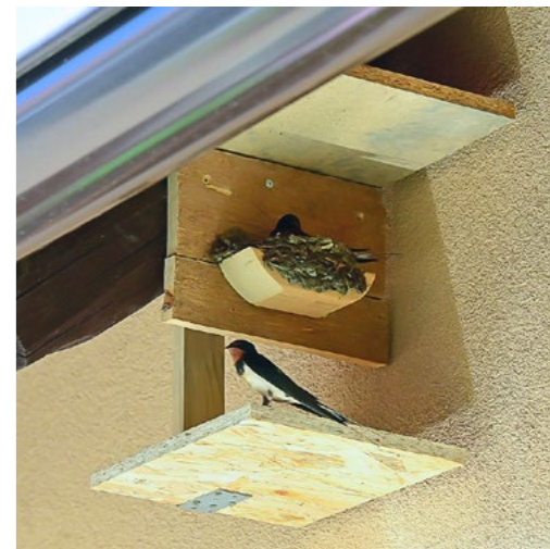
Jak pomoci vlaštovkám a zabránit znečišťování hnízdní podložka.

Z vlastní zkušenosti jsem mohl pozorovat vývoj území tůň v ochranném pásmu nejcennější