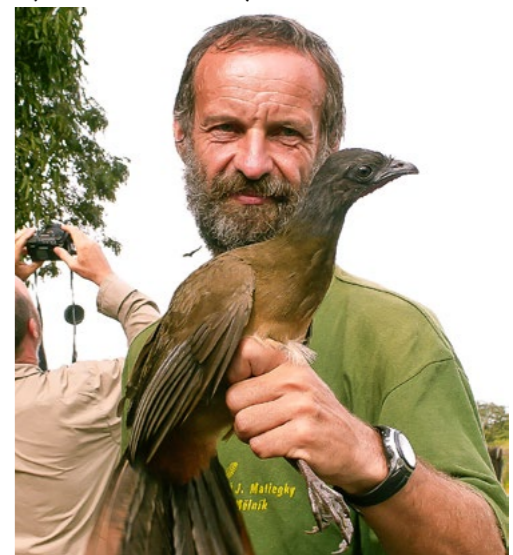
Čačalaka rudořitná je divoký pták, ale na farmách je chován jak u nás slepice

Kajmánek putoval do plátěného pytle pro zítřejší dokumentaci a my se vrátili na farmu. Cle-