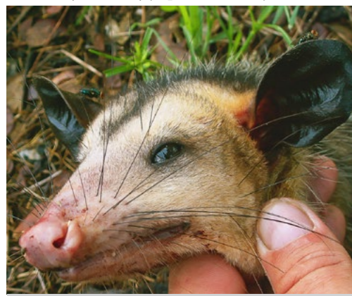
Portrét farmářem zastřelené vačice

nechali napálit úlovkem, který bych ve dne zvládl i já. V noci nás vyrušil výstřel, ale to mne ze spacáku nezvedlo. Všichni farmáři mají zbraně a mnohdy i důvody je použít. Ráno jsme ten dů-