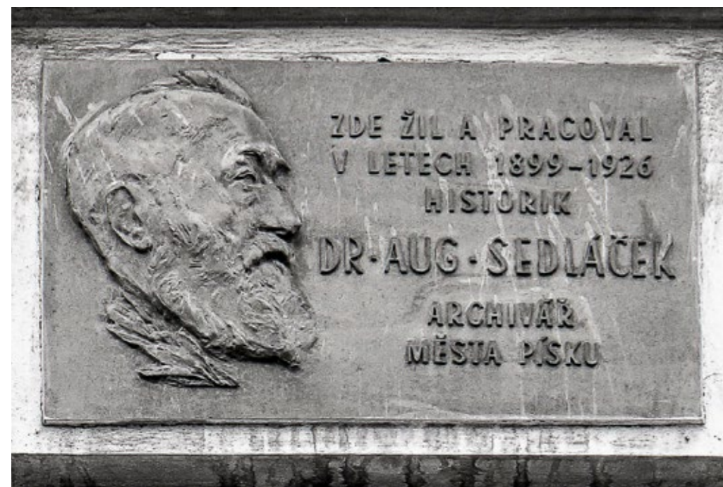
Pamětní deska v Žižkově ulici.

Sedláčkovo monumentální patnáctisvazkové dílo Hrad, zámky a tvrze Království českého stále tvoří nezbytný základ českého kastelologického bádání. Písku a Písecku patří svazky Písecko a Prachensko. Písku věnoval třídílnou knihu Dějiny královského krajského města Písku nad Otavou, která postupně vyšla v letech 1911 – 1913. Obsáhla publikace, do které čerpal údaje zejména z píseckého městského archivu, který uspořádal, je stále nepostradatelnou pomůckou pro historiky.