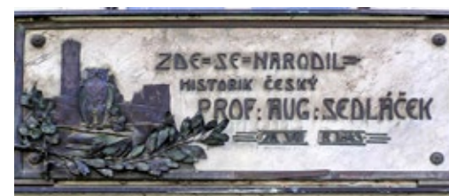
Pamětní deska na Sedláčkově rodném domě v Mladé Vožici.

Prohlídka školy bude zájemcům umožněna vždy v 11:00 a ve 14:00.