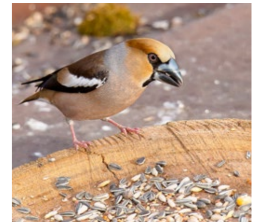
Samec dlaska na krmítku.

Výše uvedené aktivity a zkušenosti mne vedly k sepsání námětu na využití chráněných území k propagaci ochrany přírody u veřejnosti právě s využitím oblíbenosti ptáků. Díky tomu jsem se v květnu 1991 zúčastnil konference východoev-