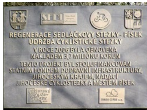
Pamětní deska na Sedláčkově stezce.

Autor je archeolog, který po celý život odborně působí v jižních Čechách.