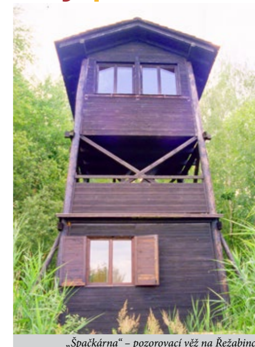
„Špačkárna“ – pozorovací věž na Řežabinci