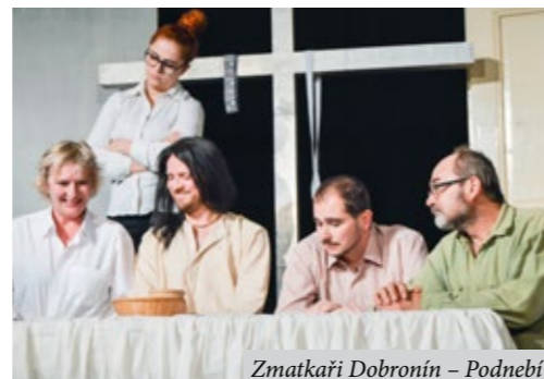
Zmatkaři Dobronín – Podnebí

Sobota 29. 1. 10.30: Ochotnický spolek ŽUMPA Nučice – Klub. Přijměte pozvání do bašty malo-