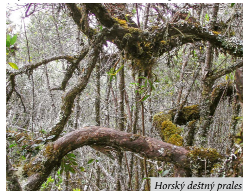
Horský deštný prales

Z uvedeného je zřejmé, že během této noci nepůjde o spánek, ale o snahu přežít bez poškození zdraví. Mohu zodpovědně prohlásit, že jsme pro to dělali, co se dalo. Nikdo se o spánek ani nepokoušel. Zvlášť proto, že ten by odpočinek neposkytl, ale mohl by se stát pro spáče osudným. Další nebezpečnou okolností byl pokles teploty k nule. Měli jsme dokonce hlídače, který nás kontroloval, abychom neusnuli únavou a neprochladli. Petr