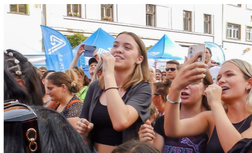
Hity Michala Davida si v Písku zpívaly i mladé dívky.

MICHAL DAVID: Patří mezi nejúspěšnější české zpěváky. Narodil se 14. července 1960 v Praze a jeho původní jméno je Vladimír Štancl. V jeho šesti letech se rodiče rozvedli, otec s dcerou se odstěhovali do Švýcarska, Vladimír s matkou do Itálie. Po návratu do Prahy vystudoval konzervatoř, v roce 1976 založil jazzové kvarteto Čtyři. Později se stal členem jeho