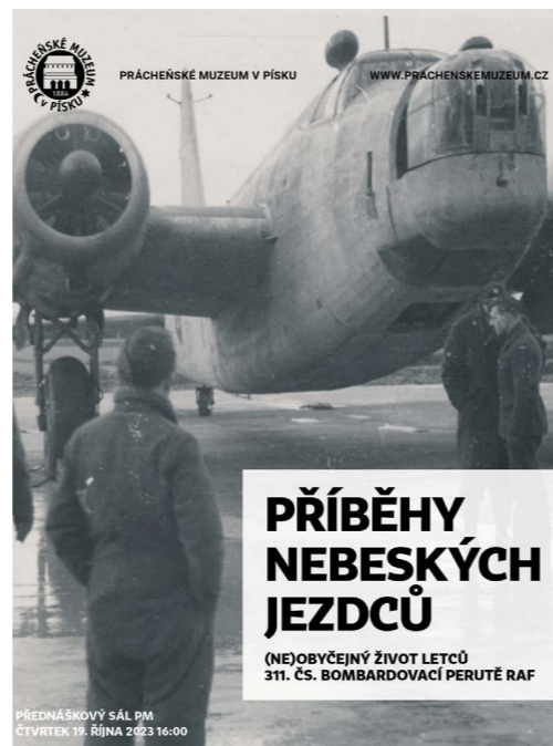
Přednáškový sál PM Prácheňské muzeum v Písku

s německými stíhači i vrtkavým počasím. Posléze na dlouhých denních misích naháněli nepřátelské ponorky po blízkých mořích.