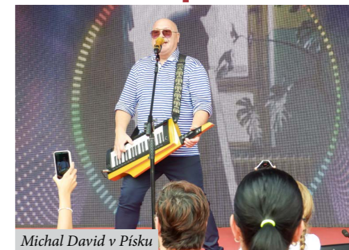
Michal David v Písku

Hvězdou úvodního zastavení letošního ročníku podzimní osvětově-zábavní akce Blesk Ordinance, která se konala v úterý 12. září na Velkém náměstí v Písku, byl zpěvák Michal David (63). Ten svými hity v odpoledním půlhodinovém vystoupení přivedl do varu stovky diváků. Ještě před začátkem koncertu poskytl oblíbený zpěvák Píseckému světu exkluzivní rozhovor.