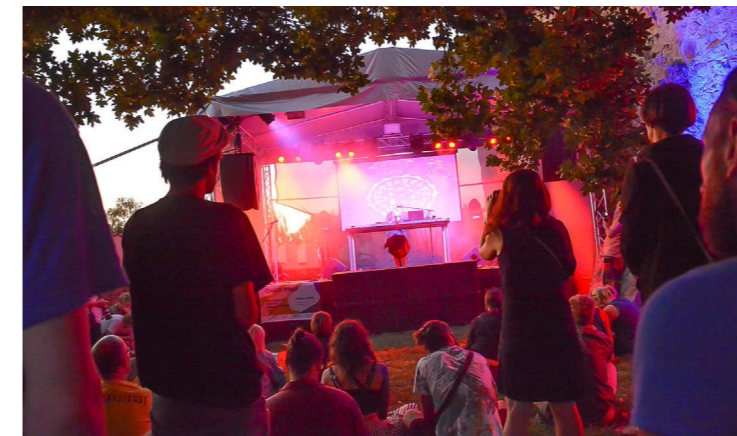
COOL V PLOTĚ: Fotoreportáž Martina Zborníka z letošního ročníku skvělého festivalu Cool V Plotě, který se konal 8. - 9. září, si můžete prohlédnout na FB Píseckého světa. Už se těšíte na příští rok!

DALŠÍ ČÍSLO vyjde ve čtvrtek 5. a 19. října. Uzávěrka inzerce vždy v pondělí před vydáním.