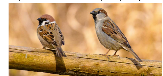
Vrabec polní vlevo, samec vrabce domácího vpravo.

Citují: „Dávno již jest tomu, co v našich lesích ptactvo se takřka hemžilo, neboť již jen výjimečně naléztí lze lesy, v nichž naši opeřenci četněji jsou zastoupeni. Na jednu příčinu tohoto zjevu bylo poukázáno již předem, míníme tím nynější převládající způsob hospodaření v lesích pasečením na holo a šablonovitým vychováváním porostů stejnověkých. Vedle toho zaviněno bylo ubývání ptactva