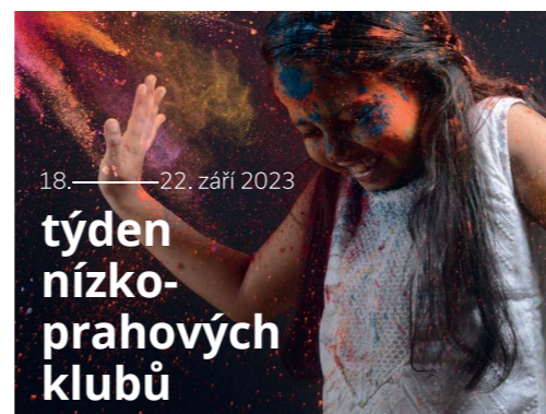
18. – 22. září 2023

Rodiče, zástupci samospráv, neziskové organizace, pedagogičti pracovníci, žáci i široká veřejnost mají možnost nahlédnout do nízkoprahových zařízení a podrobně se seznámit s jejich nabídkou a celkovým přínosem. Pracovníci klubů umí s klienty navazovat bezpečný a důvěrný vztah, intervenovat a předávat je v případě potřeby do návazných institucí. Nízkoprahové kluby jsou bezpečným místem i oporou. Školám mohou kluby nabídnout i spolupráci s žáky, kteří potřebují pomoci s přípravou do školy nebo jsou