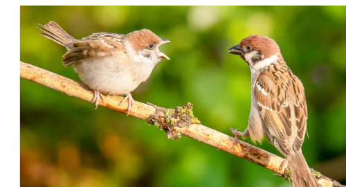
Vrabec polní s mládětem.

Ve svém prvním příspěvku jsem zmiňoval dobu od 80. let minulého století s tím, že se stav přírodního prostředí zhoršoval. Protože jsem nejen zoolog, ale i muzejník, zapátral jsem v literatuře, jaké dojmy měli z přírody naši předkové.