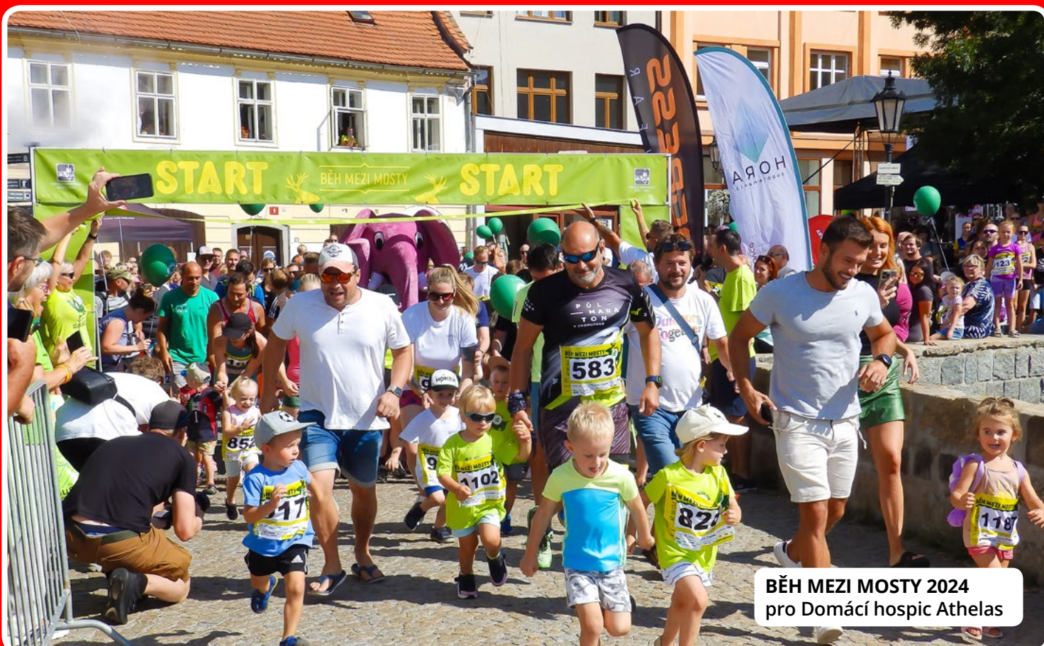
BĚH MEZI MOSTY 2024 pro Domáci hospic Athelas