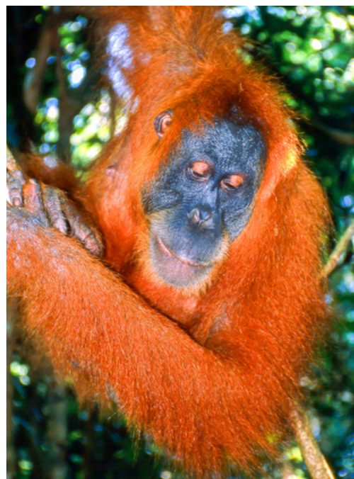
Orangutan sumaterský – Indonésie

byla nejdelší (4. března – 25. dubna 1995) a také nejnáročnější. Neměli jsme totiž žádné praktické zkušenosti s létáním a s problémy se zavazadly, ani s jednáním místních orgánů a obyvatel, také s obstaráváním potravin a s finanční náročností provozu expedice včetně drahoty na některých místech. Kdo třeba mohl tušit, že ovoce a zelenina bude na francouzských zámořských územích ostrovů Guadeloupe a Martinique, kde se pěstuje, dražší než ve Francii, kam se dováží. Putovní výstava o expedici Zoogeos na 4 ostrovy Malých Antil byla v letech 1996 až 2002 představena na 13 místech. V roce 1997 jsme navštívili sever Afriky – Maroko. Výstavu o ní viděli lidé v šesti městech.