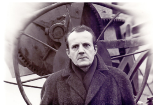
Vladimír Boudník

Boudník měl vliv i na celou generaci tvůrců českého informelu, kteří koncem 50. let studovali na Akademii výtvarných umění a na řadu grafiků, kteří si jeho grafické techniky osvojili. Boudníkovy výtvarná stopa rezonuje i v mnoha dílech současných umělců. Přátelil se s Bohumilem Hrabalem a byl svými deníkovými zápisky zásadní inspirací pro jeho literární dílo Něžný barbar (rovněž stejnojmenný film režisérky Věry Chytilové