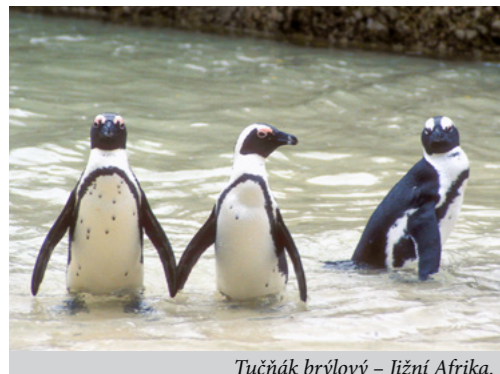
Tučňák brýlový – Jižní Afrika.

Úspěch antilské expedice a výstavy o ní nás vedl k záměru v expedicích pokračovat. Za 30 let naší činnosti jsme uskutečnili 14 zahraničních expedic. Ta první na ostrovy Malých Antil (Guadeloupe, Dominicu, Martinique a Svatou Lucii)