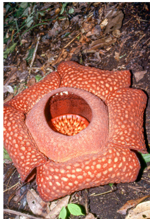
Raflézie Arnoldova, největší květ na světě – Indonésie.

kteří umožnila okno do světa skutečně pootevřít. Jedinečné výstavy, přednášky, publikace a dokonce i stálá expozice v Protivíně seznamují návštěvníky regionálních muzeí malé země ve střední Evropě s exotickou přírodou dalekých zemí, ale i s tradiční kulturou a způsobem života v oblastech, které nejsou vyhlášenými turistickými letovisky cestovních kanceláří, konfrontují „vlastivědu“ těchto dalekých končin s tou naší, tradiční.