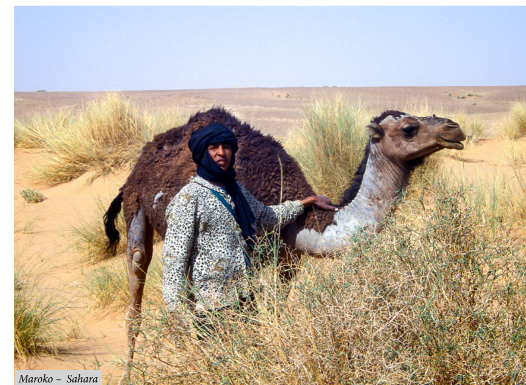
Maroko – Sahara

O dovolených a víkendech jsme vydělávali peníze zoologickými průzkumy chráněných území a posudky vlivu staveb na životní prostředí a sháněli podporovatele z řad podnikatelů v rámci smluv o reklamě. To jsme si mohli díky neziskovce dovolit, protože jsme se zaručili, že s výsledky a dokumentací expedice seznámíme veřejnost prostřednictvím putovní výstavy v muzeích. Kromě toho jsme jednali o podpoře s ministerstvy kultury a životního prostředí. Potřebovali jsme oficiální záštitu, která nám zase umožnila jednat s politiky a odbornými organizacemi antilských ostrovů. Vše se povedlo a zjara 1995 jsme odletěli na Guadeloupe , první z šesti plánovaných ostrovů Malých Antil. O této expedici jsem napsal cestopis.