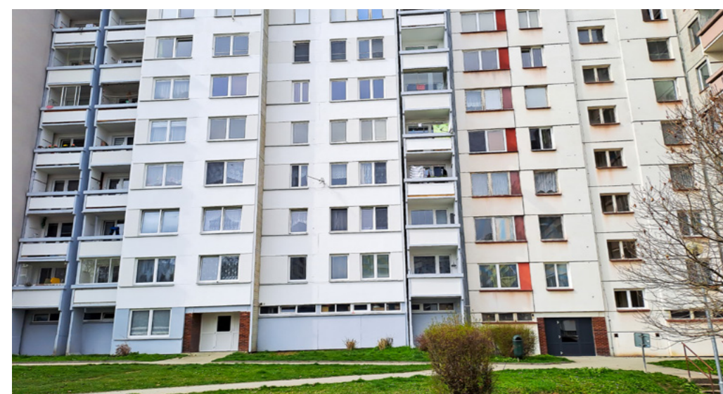
Sídliště Portýč – Vpravo před obnovou, vlevo po obnově. Vpravo zachovaný obklad vstupu evokující portál – černé dveře s moderní architekturou ladí lépe než bílé. Vlevo lacině působící bílé dveře, průběžné římsy upomínají na pásová okna. Do fasády se jemně propisují pásová okna, zachovaný obklad vstupu je obdobou historických portálů. Vstupní dveře jsou elegantnější v černé nebo více prosklené.