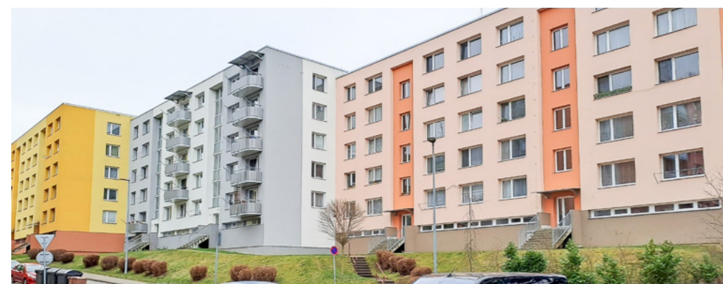
Sídliště Jih – šedý dům zachoval plně prosklení schodiště, které je ozdobou domu. Dobře pracuje s barvou, zvýrazňuje nároží a barevně odlišuje plně štítové a okenní panely.