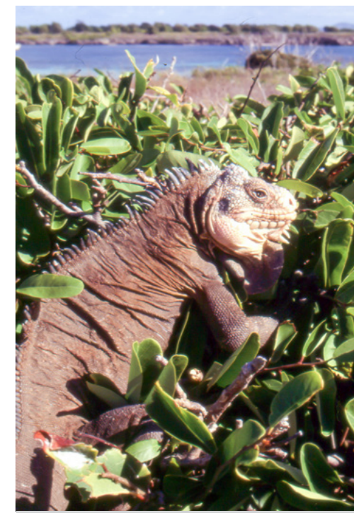
Leguán chutný, Malé Antily

Krátce po mém adoptování do spolku cestovatelských bláznů jsem na vše zapomněl. Ale časem se plán ze Starých Splavů vracel. Jeho návraty byly stále častější, až jsem ho přijal za svůj a začal na něm aktivně pracovat. A jak jsem zjistil, nebyl jsem v tom sám. Všichni jsme na tom byli stejně. Stalo se to posedlostí a bylo jasné, že musíme podniknout něco konkrétního.