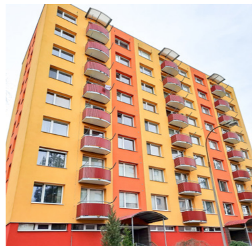
Sídliště Jih – agresivní barevnost, nadbytečné pruhy.

Převládá koncepční a komplexní řešení, samozřejmě je participace a pravidla pro developery, kteří musí území zhodnotit investicemi do infrastruktury či školství, nejen využít jako dřív. Na Slovensku adaptují objekty technické infrastruktury (výměníky tepla) na komunitní centra namísto jejich nahrazování věžáky. V Německu jsou dostavby vždy nižší než okolní zástavba, trendem je ochrana před přehříváním a zadržování dešťové vody v zelených plochách sídlišť, parkoviště s propustným povrchem a skrytá stromy, větší využití cyklodopravy,