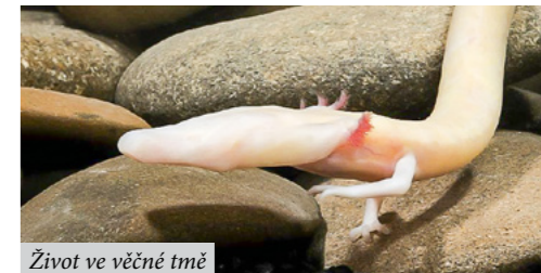
Život ve věčné tmě

Na 18. květen připadá Mezinárodní den muzeí. Ve světě se slaví od roku 1977, Česká republika se k němu připojila v nultých letech, kdy vznikl i oblíbený Festival muzejních nocí. V květnu nás toho ale čeká mnohem víc.