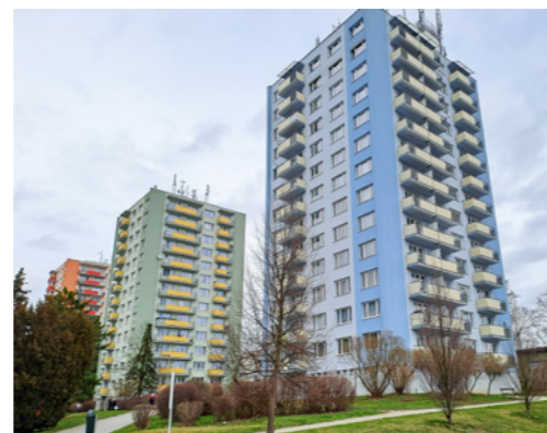
Sídliště 1. Máje - Zateplení trojice věžových domů má jednotící, ale přesto příliš odlišné řešení. Trojice tvoří jednu skupinu, do budoucna jí prospěje větší střídmost a jednota, odlišení např. jen balkony.

Rozhovor byl připraven pro březnové vydání časopisu Pro města a obce, měsíčník s inspirativními informacemi pro zastupitele a úředníky. Zveřejňujeme jej s laskavým svolením redakce.