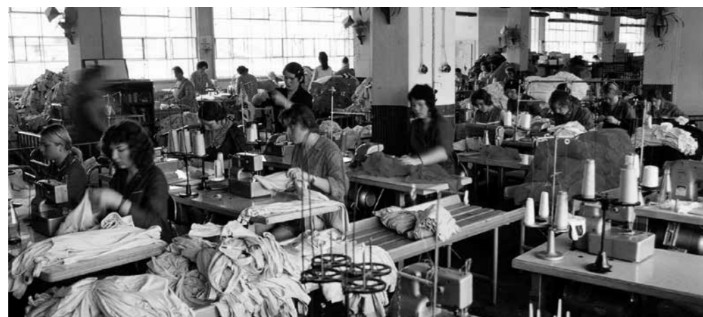
Rok 1973.