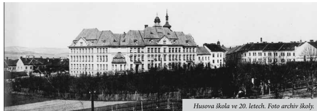
Husova škola ve 20. letech.