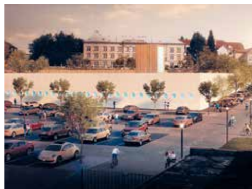
Nejsledovanější z připravovaných staveb je zřejmě nový bazén – vizualizace připravovaného projektu.

Cyklistická stezka a chodník v průmyslové zóně Dobešická (10,3 mil.), Městská knihovna Písek – centrum celožitovního vzdělávání (185 mil.), Rekonstrukce úpravny vody (140 mil.), Chodník a cyklostezka Hřebčinec – Semice – Smrkovice (10 mil.), Chodník propojující obchodní zónu s lokalitou Hradiště – Písek (5 mil.), Revitalizace centra města (40 mil.), Cyklostezka u Klášterních rybníků (2 mil.), Regenerace plovárny U svatého Václava – II. etapa, 2. část (10 mil.), Plavecký bazén (200 mil.), Noclehárna, nízkoprahové denní centrum (6,7 mil.), Rekonstrukce ulice Na Hou-