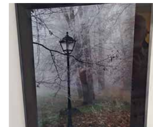
Text a foto: KAREL PECL, ornitolog a fotograf – člen PUB