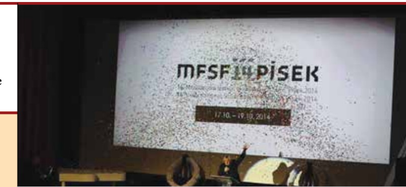
Mezinárodní festival studentských filmů 2016 se blíží! Foto ze zahájení 14. ročníku.