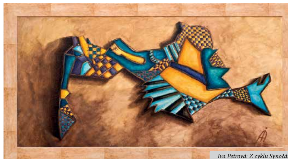
Iva Petrová: Z cyklu Synočáry