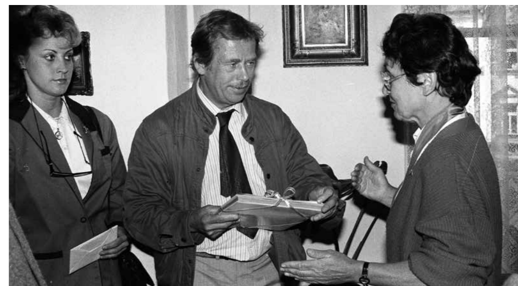
Václav Havel v roce 1990 s tehdejší starostkou Věnceslavou Skřivánkovou, foto V. Komasová.