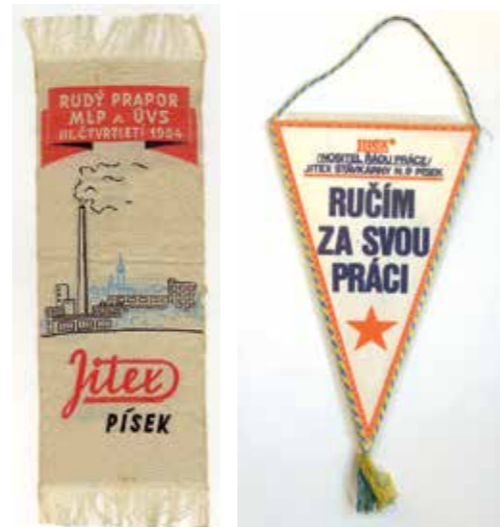
Dobová ozdobná knižní záložka a vlaječka. Ze sbírek Prácheňského muzea v Písku.