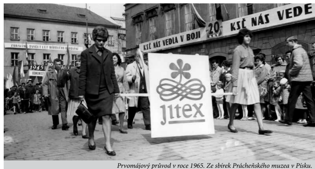
Prvomájový průvod v roce 1965. Ze sbírek Prácheňského muzea v Písku.