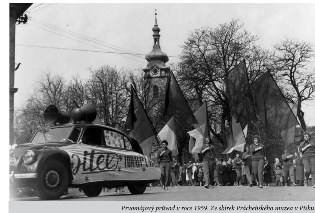
Prvomájový průvod v roce 1959.