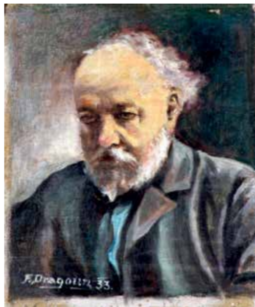
Mikoláš Aleš, 1933